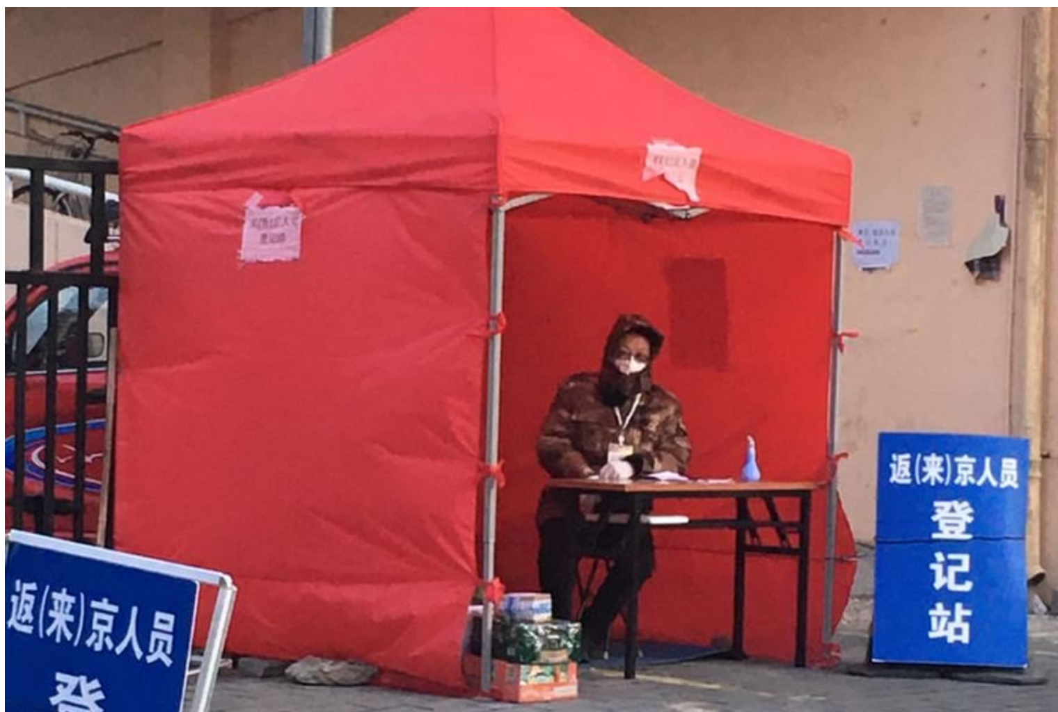
Вход в жилые микрорайоны.

всего этого система выдает посетителю пропуск или отказ.